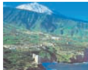
Maritim Hotel Tenerife mit El Teide

Im wunderschönen Orotava-Tal, das sich im Norden der Insel befindet, liegt auch das Maritim Hotel. Der Ort heißt Los Realejos und ist nicht weit vom „Real Club de Golf de Tenerife“