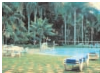
Pool im Tropengarten des Maritim Hotels Teneriffa

sich der berühmte „Loro Parque“ mit seinen exotischen Tieren und Shows sowie der „Playa Jardín“, der von dem Landschaftsarchitekten César Manrique gestaltet wurde. Das Maritim Hotel Teneriffa bietet 296 elegant eingerichtete Zimmer inklusive 32 Familienzimmern, 8 Suiten, 4 Penthouses und 2 Luxus-Suiten. Alle Zimmer sind exklusiv und mit der obligatorischen Klimaanlage ausgestattet. Alle Zimmer haben Balkon mit Meer-, oder mit Gartenblick. Ein kostenloser Hotelbusservice bringt die Gäste 10 x täglich zum Zentrum von Puerto de la Cruz, ca. 2 km entfernt (außer an Sonn- und Feiertagen). Drei Süßwasser-Poollandschaften (eine davon beheizbar) mit