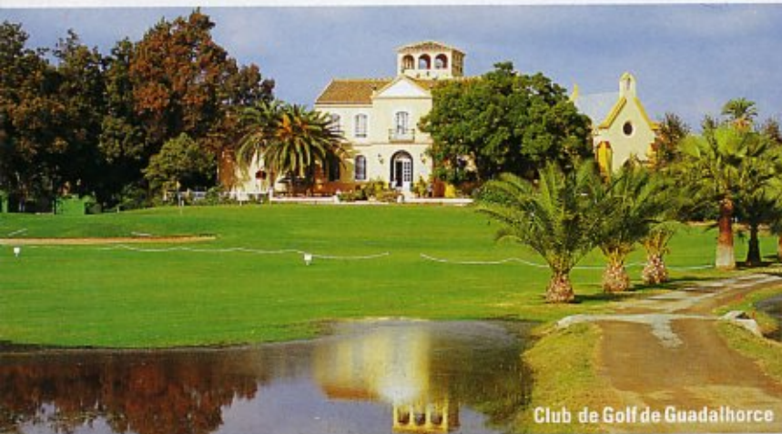
Club de Golf de Guadalhorce