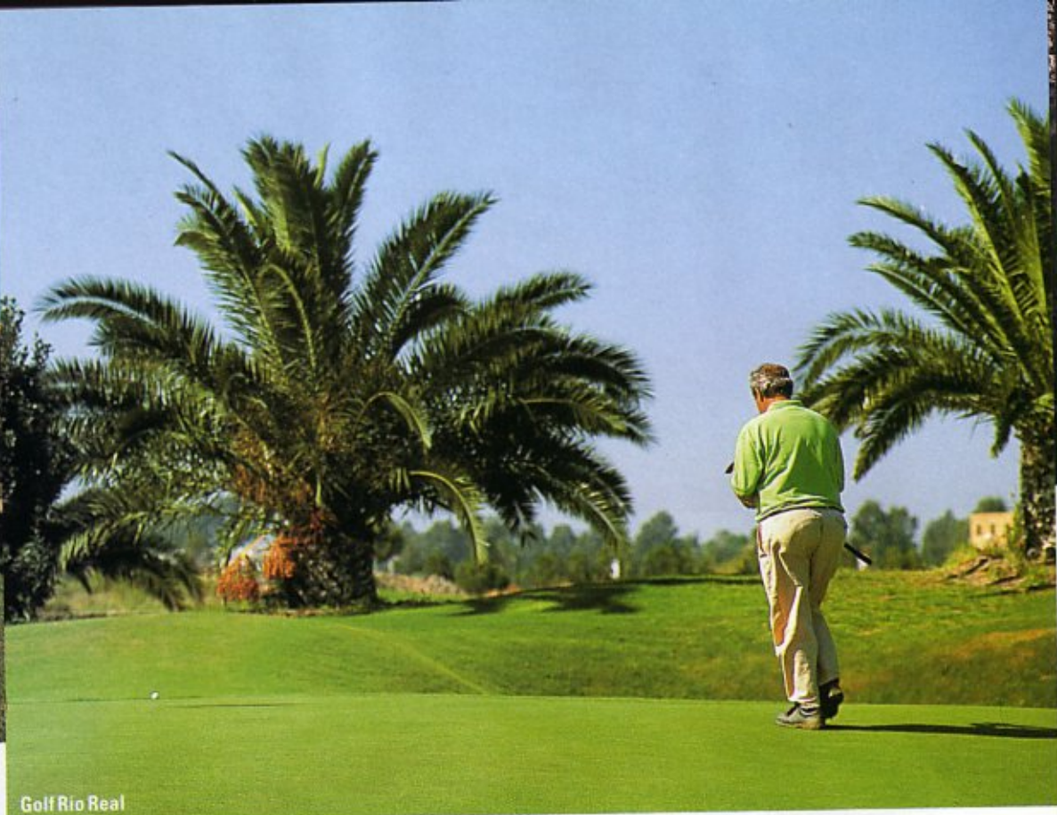
Golf Río Real