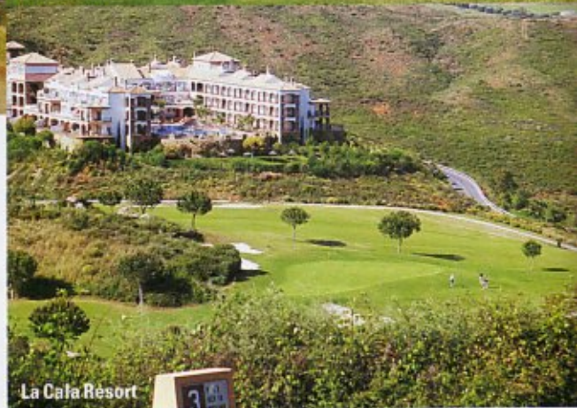
La Cala Resort